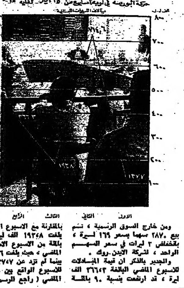
اجتماع في بورصة بيروت...